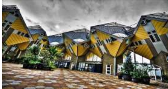
Şekil 9. Mimar Piet Blom, Rotterdam / Hollanda

Şekil 9'da Kübizm akımında bir bina tasarımı verilmektedir. Şekil 10, 11'de kavramsal fotoğrafa örnek sayılabilecek çekimler sunulmaktadır.