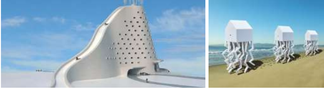
Şekil 16. Michael Jantzen (wevux.com) Şekil 17. Michael Jantzen'in Kavramsal Mimari ve Sanat Projeleri (umityaldiz.com)

Şekil 16 ve 17de Michael Jantzen'in kavramsal sanat çalışması görülmektedir. Michael Jantzen, dünya çapında bir sanatçı ve tasarımcı olarak tanınmaktadır.( archinect.com) Kitap, dergi, gazete ve Web'de binlerce makalede yer almıştır. Eserleri birçok galeride ve çeşitli televizyon belgesellerinde gösterilmektedir. Ayrıca Ulusal Yapı Müzesi, Kanada Mimarlık Merkezi, Harvard Tasarım ve Mimarlık Okulu, Santa Fe Enstitüsü ve New York'taki Modern Sanat Müzesi'nde sergilenmiştir. Çalışmasının çoğu sanat, mimarlık, teknoloji ve sürdürülebilir tasarımı tek bir deneyime dönüşmektedir. (www.michaeljantzen.com/)