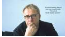
Şekil 2. Joseph Kosuth (milliyet.com.tr, 23.11.2012)

Joseph Kosuth kavramsal sanatın ünlü isimlerindedir. 7.Contemporary İstanbul etkinliğinde “Sanatın en büyük düşmanının ‘piyasa’ olduğunu söyleyen sanatçı, koleksiyoncuların uyguladığı baskının, yaratım sürecini olumsuz etkilediğini söyledi. Sanatın, at yarışı gibi görülmemesi gerektiğinin altını çizen Kosuth; “Hatalara izin verilmeli. Hatalar yaratıcılığı artırır” dedi. ‘Saklı anlam taşımalı’, “Sanatın, doğrudan görülmeyen bir anlam taşıması gerekir” ifadeleri ile kavramsal sanatın felsefesini özetlemektedir. (milliyet.com.tr, 23.11.2012)