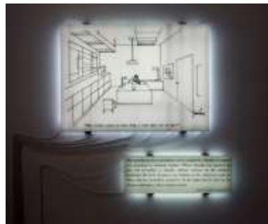
Şekil 6. Joseph Kosuth, Kavramsal Sanat Eseri: Teknik Çizim + Metin (spruethmagers.com)

Kosuth'un eserlerine karşı kavramsal olup olmadığı konusunda tartışmalar yapılmakta, gerçek ürüne eserde yer verdiği için bir fikrî çelişki oluşturduğunu söyleyenler bulunmaktadır.