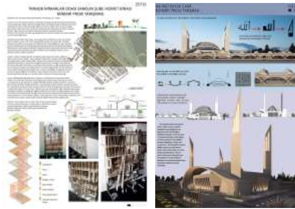
Şekil 13. TMMOB Mimarlar Odası, Samsun Şube Hizmet Binası Mimari Tasarım Yarışması 1. Ödül Konsept paftası (arkitera.com) Şekil 14. Mehmet Kavuk Camii Konsept Proje Yarışması 1. Ödül Pro-Ge Proje Ofisi(Arslan, B., 2014 (arkitera.com))