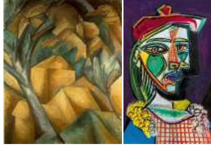
Şekil 7. Georges Braque L'estequa'da Evler Şekil 8. Pablo Picasso

Kavramsal sanat, uygulamaya geçmeden önce ciddi bir ön çalışma, hassasiyet, detaylandırma ve dakiklik gerektirmektedir. Yapım sistemlerinden prefabrikeye benzeyen bu kısmı ile ön çalışmanın ciddi ve fazla olması gerekliliğinin önemi vurgulanabilir. Ön fikir çalışması ile kavramın oturması, hayaldeki eserin nasıl ortaya çıkacağına değil, çıkarının kabulünü işaret etmektedir. Dıştan nasıl görüldüğü ile birlikte arkasındaki kavram/lar ve içine verilmek istenen ruh yönü ile de kübizme benzemektedir. Çünkü kavramsal sanatta içeriği oluşturan fikir önemlidir, içinde yer alan duygular ve düşünceler önemlidir. Arkasında hafızada yazılı bir metin vardır. Kübist resimlere Şekil 7 ve 8 örnek olarak verilmiştir.