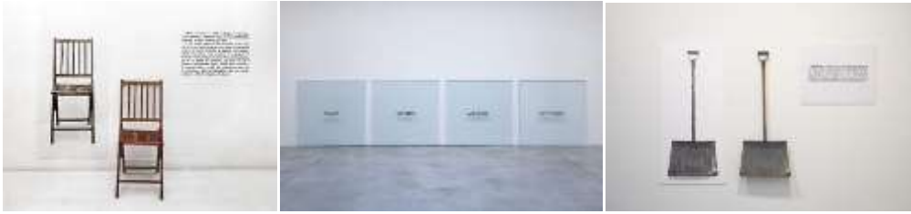
Şekil 3. Joseph Kosuth - One and Three Chairs Şekil 4, 5.

Kosuth'un eserlerine karşı kavramsal olup olmadığı konusunda tartışmalar yapılmakta, gerçek ürüne eserde yer verdiği için bir fikrî çelişki oluşturduğunu söyleyenler bulunmaktadır.