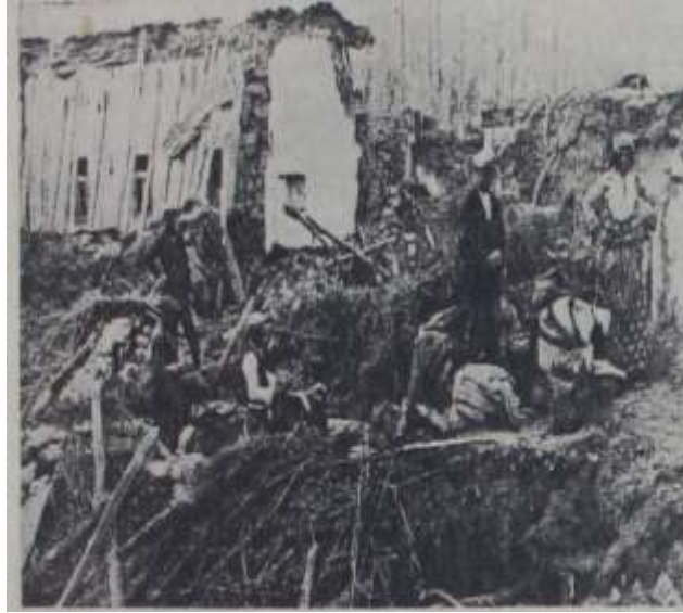
RESİM-2: ( Cumhuriyet , 22.04.1938).

* Kırşehir’de hasara uğramayan köy ve kasaba kalmadı ( Son Posta , 22.04.1938)