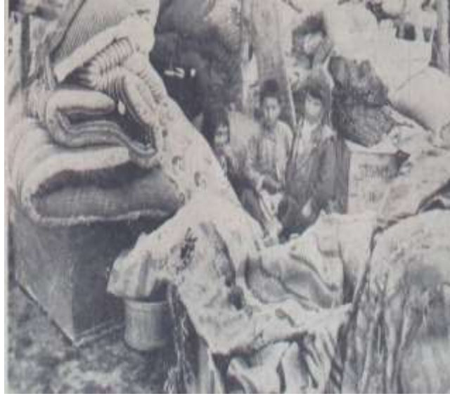
RESİM-5: ( Cumhuriyet , 23.04.1938).