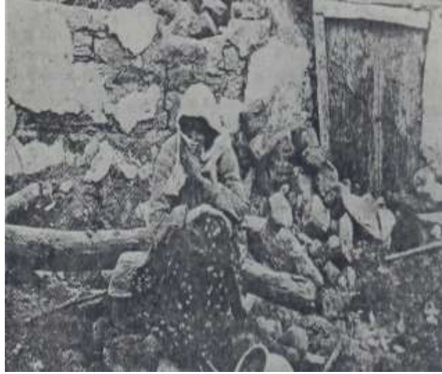
RESİM-4: ( Cumhuriyet , 22.04.1938).