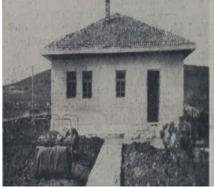
RESİM-6 Deprem Sonrası Çatlaklar Oluşan ve Boşaltılan Sofular Jandarma Karakolu ( Cumhuriyet , 27.04.1938)