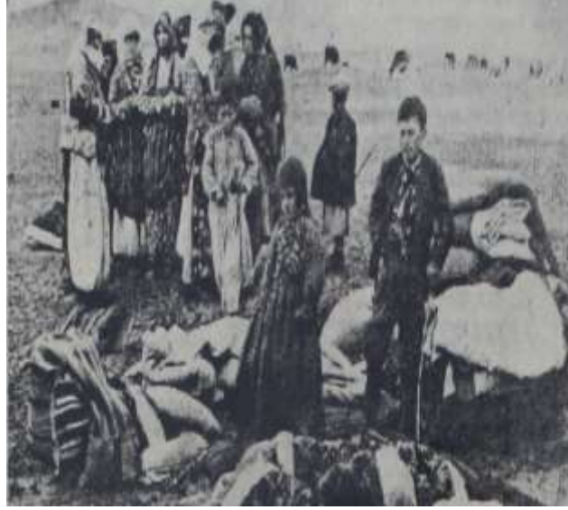
RESİM-3: ( Cumhuriyet , 22.04.1938).