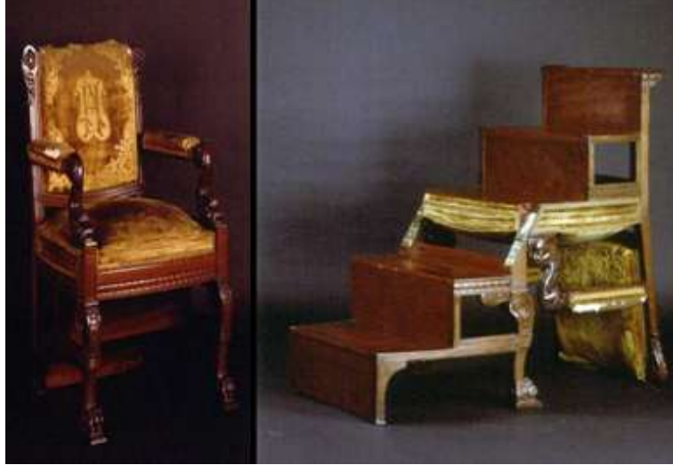
Resim 8. II. Abdülhamid tasarımı çok işlevli oturma mobilyası- Dolmabahçe Sarayı.

Almanya'dan makine ve teçhizat, ustalar getirtmiştir. Kendisi de boş zamanlarında bu atölyede mobilyalar üretmiştir. Hatta Sultan Abdülhamid'in bu mobilyaları yapmak için önce mağazalara mobilya sipariş ettiği, satın aldığı mobilyaları bu atölyede inceleyerek aynısını imal ettiği bilinmektedir (Demirarslan ve Aytöre, 2005: 127). II. Abdülhamid'in üretmiş olduğu mobilyalar arasında çok işlevli oturma elemanı da bulunmaktadır. Yapmış olduğu bir tasarımda iskemle gerektiğinde merdivene dönüşebilmektedir (Resim- 8). Dolmabahçe, Beylerbeyi, Yıldız sarayları ve kasırlarda bulunan oturma mobilyaları çoğunlukla Neoklasik, Neobarok ve Neorokoko üslup özelliklerini göstermektedir. XV. ve XVI. Louis üslubundaki koltuklar bilhassa Dolmabahçe ve Beylerbeyi saraylarında yer almaktadır (İrez, 1988: 34). 1844 Fransız Sanayi ve 1851 Londra sergileri sarayların mobilya seçiminde etkili olmuştur. Paris, Londra, Viyana, Şam ve Bombay kataloglardan beğenilen mobilyaların getirildiği başlıca şehirlerdir. Sarayların yeniden döşenmesi konusunda Mösyö Briston, Mösyö Perşon ile Mösyö Séchan çalışmıştır. Tamirhane-i Hümayun'da üretilen ve Türk- Osmanlı süsleme sanatı özelliklerini barındıran oturma mobilyaları ise tüm saray mobilyaları içinde ayrı bir tarza sahiptir (Resim- 9).