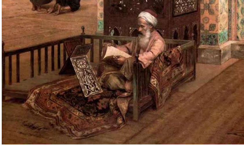
Resim 2. Oryantalist ressam Rudolph Ernst'in resminde kerevet betimlemesi (URL-3).

Kerevet üzerine şilte serilerek yatmaya veya oturmaya yarayan, duvara bitişik, ayakları olan, tahtadan sedirdir (URL-2). Günümüzde Anadolu evlerinde halen kullanımı devam etmektedir ve bazı yörelerde “peyke” olarak isimlendirilmektedir (Resim- 2).