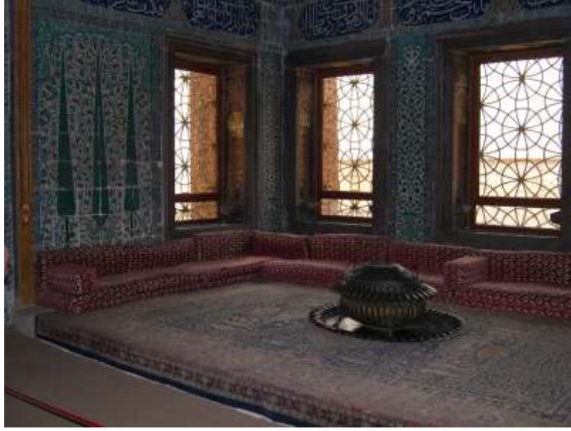
Resim 3. Topkapı Sarayı sedirler.