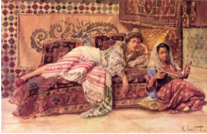
Resim 5. Minderler Oryantalist resimlerin de önemli kompozisyon parçalarını oluşturmaktadır. Ressam Rudolph Ernst'in Okuyucu adlı tablosu ve divan ( URL- 4 ).

Bu oturma elemanlarının dışında Batı tarzı oturma şeklini sağlayan oturma mobilyaları Batılılaşma öncesi dönemde Türk kültüründe görülmektedir. İskemleler ve tabureler Osmanlı toplumunda en fazla kullanılan oturma mobilyalarıdır. Yemek iskemlesi, yemiş iskemlesi, hoşaf iskemlesi, tıraş iskemlesi, fanus iskemlesi olarak çok çeşitli yapılan bu iskemlelerin yapımında sedefkâri, edirnekâri, eyübkâri, marangozkâri gibi çeşitli yapım, uygulama ve süsleme teknikleri kullanılmaktaydı (Demirarslan, 2017: 188). Bilhassa sedefkâri tekniği ile yapılan ve “Şam İşi” olarak isimlendirilen iskemleler sadece Osmanlı’da değil; Avrupa’da da yaygın bir şekilde kullanılmıştır. Bu iskemleler saraylarda özellikle yabancı elçilerin kabulleri sırasında kullanılmıştır. İskemlelerin en fazla görüldüğü mekân kahvehanelerdir. “Kürsü” olarak isimlendirilen alçak tabureler de özellikle kahvehanelerde kullanılmıştır. Kırsal kesimde iskemle ve tabureler önce-leri evlerde derme- çatma üretilirken zamanla dışarıdan satın alınır hale gelmiştir.