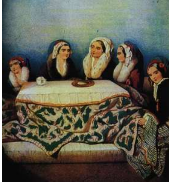
Resim 4. Geleneksel Türk yaşamında tandır kullanımı. (Evren ve Can, 1997: 22)

Divan ise geleneksel Türk konutunda bazı yörelerde sedir ile aynı anlamda kullanılmakla birlikte, Batılılaşma öncesi geleneksel Türk yaşamında çoğunlukla oturma amacıyla kullanılan arkalıksız kanepelerdir. Hatta bu oturma mobilyası Batı mobilyasını da etkilemiş ve Avrupa’da arkalıksız kanepelere “divan” ya da “sofa” ismi verilmiştir. Günümüzde Batı dünyasında bu mobilyalar halen bu isimle anılmaktadır. Minderler ise konutlardan saraylara herkesin yerde konforlu oturma gereksinimini karşılamak üzere kullanılmıştır. Batı dünyası Oryantalizm döneminde bu minderlerden etkilenmiş ve Avrupa’da minderler üzerinde oturmak moda halini almıştır (Resim- 5). Bu minderlerden esinlenerek yaptıkları alçak puflara da “Ottoman” adını vermişlerdir. Ottoman isimli puflar günümüzde Batı’da halen yaygın şekilde kullanılmaktadır.