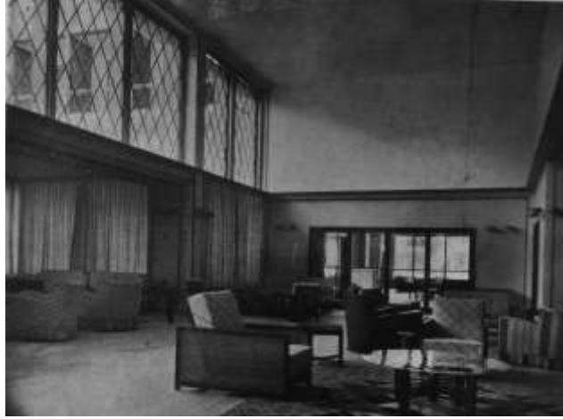
Resim 10. Sedad Hakkı Eldem tasarımı kübik koltuklar Yalova Termal Oteli (Eldem, 1938)

Cumhuriyetin ilk yıllarında bazı mimarlar dönemin "Bütüncül Tasarım" (Gesamtkunstwerk) anlayışı doğrultusunda inşa ettikleri binaların iç mekânlarında kullanılmak üzere oturma mobilyaları da tasarlamışlardır. Örneğin; Sedad Hakkı Eldem'in Yalova Termal Oteli projesi için tasarlamış olduğu kübik tarzdaki koltuklar bu konuda önemli bir örnektir (Resim-10). Sedad Hakkı Eldem de Vedat Tek gibi modern mobilyalar tasarlarken bir yandan da geleneksel Türk evinden ilham alarak sedirli iç mekânlar tasarlamıştır. Taşlık Şark kahvesindeki oturma elemanları geleneksel sedirden oluşmaktaydı.