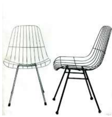
Resim 11. Sadi Öziş tasarımı metal mobilyalar 1964 (URL- 5)

1970-80’li yıllarda özellikle serbest meslek sahibi ailelerin konutlarında oymalı ve süslü oturma mobilyalarına doğru bir yönelme olduğu görülmektedir. Bu oturma mobilyalarının fiyatları yüksek, kendileri ise hacimli mobilyalardır. Ailenin günlük yaşamını sürdürebilmesi için yatak odalarından biri oturma odası olarak kullanılmaya başlanmıştır. Oturma odalarında bir yandan divan, sedir, kanepeler, koltuk, sandalye, yataklı kanepeler tipik oturma mobilyaları olarak karşımıza çıkarken, 1990’lı yıllardan itibaren PVC oturma elemanı tasarımları kullanımı artmıştır. Artık bu dönemden sonra oturma mobilyası sadece iç mekânların değil peyzaj ve kent düzenlemelerinin de bir parçası haline almıştır.