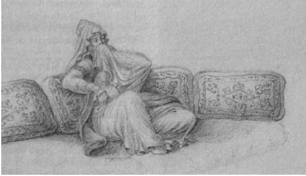
Resim 6. Melling'in kaleminden sedirde oturan Hatice Sultan (Hitzel,Perot vd., 2001: 23).