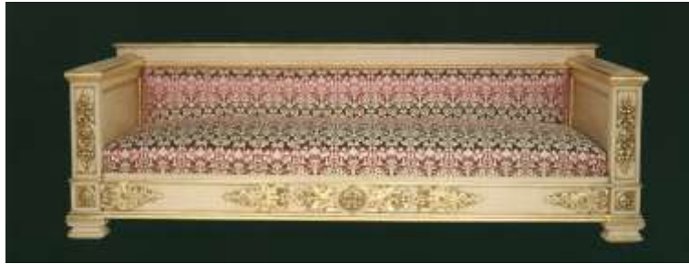
Resim 9. Dolmabahçe Sarayı bodrum kat sergi salonu sediri.

Yurtdışından getirilen mobilyalar Batılılaşmanın merkezi Pera ve Galata'da açılan mobilya ve mefruşat mağazalarında satılmaya başlanmıştır. Psalty, Haraççı, Bon Marchè, Narsis Narlıyan, Cosmo Vuccino ve Ortakları, Garrus Kardeşlerin Mevlevihane Mobilya Mağazası,