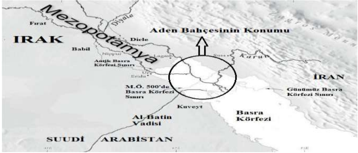
Şekil-3: Aden Bahçesinin Konumu 24

Bunun yanında yüzyıllar boyunca Aden Bahçesi'nin nerde olduğu konusunda çok farklı fikirler ortaya çıktı. İlk kilise babalarından, Aden Bahçesi'nin Moğolistan'da, Hindistan'da ve Etiyopya'da olduğunu öne sürenler olduğu gibi bu bahçenin kayıp Atlantis kıtasında olduğunu iddia eden araştırmacılar da olmuştur. 25