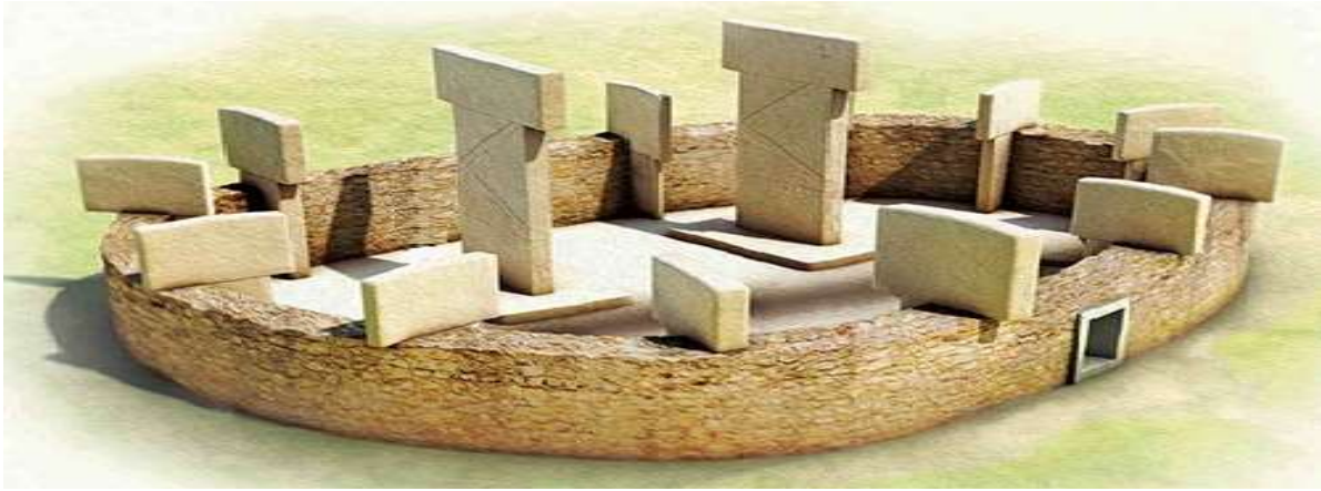
Şekil-1: Göbeklitepe'nin Dairesel Yapısı 7

Klaus Schmidt başkanlığında yapılan kazılar sonucunda bu bölgenin, daha önceden yapılmış olan arkeolojik kazılar sonucunda bulunan Neolitik yerleşim yerlerinden farklı olduğu görülmüş ve o zamana kadar hiçbir yerde görülmemiş ritüel buluntuları ile karşılaşmıştır 5 . Özellikle üzerinde hayvan figürlerinin ve bazı sembollerin bulunduğu "T" biçimindeki dikili taşlar ve bu dikili taşlardan oluşan daire biçimindeki anıtsal yapılar dikkatleri üzerine çekmiştir. 2003 yılında bu alanda yapılan manyetik ve radar taramalarında en az 20 tane çemberimsi yapının Göbeklitepe'de bulunduğu tespit edilmiş ve 2014 yılına kadar yapılan kazılarda bu dairesel yapılardan 8 tanesi gün yüzüne çıkartılmıştır 6