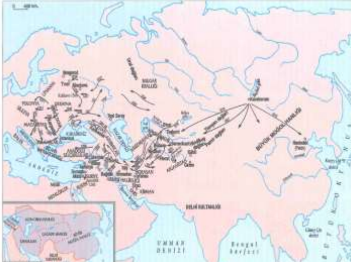
Resim 2: İslam Ansiklopedisi, Moğollar, s.227

Cengiz Han'ın Karahıtay topraklarının ele geçirilmesi batıda Harizmşahlar'a komşu yapmıştır. 18 Türk-Moğol ilişkilerinde özel bir yere sahip olan Harizmlerin tarihinin kısaca izahı konunun anlatımına katkı sağlayacaktır. Harizm ismiyle anılan coğrafi bölge Aral Gölü'nün güneyinde yer almaktadır. Harizmşahların yaşadığı bölge Selçuklulara bağlıdır. Selçuklulara bağlı olan bölgeye Sultan Melikşah döneminde Anuş Tigin vali olarak atanır ve 1097'de ölümü ile yerine oğlu Kutbüddin Muhammed Vali atanarak babadan oğula geçme geleneği oluşur. Kutbüddin Muhammed, Şah ünvanını alır ve Selçuklulara bağlı bir hükümdar olur. 1128'de ölümü ile yerine oğlu Gazi Atsız geçer. Atsız, yönettiği bölgeyi devletleştirir. Selçukluların zayıflaması ve Sultan Sancar'ın Türkmenlerin eline esir düşmesiyle Atsız'ın oğlu İl Arslan